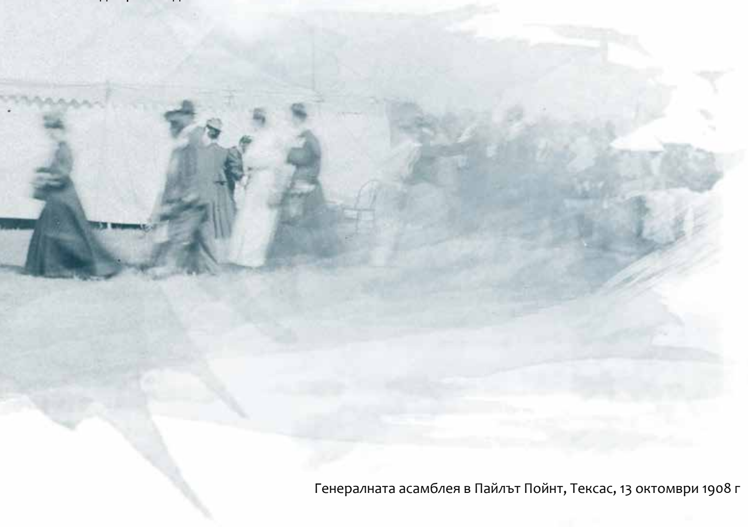
Генералната асамблея в Пайлът Пойнт, Тексас, 13 октомври 1908 г

Думата „петдесятен“ вече не се асоциирала с доктрината за светостта, както е било през XIX век, когато основателите приели това име за църквата. Новата деноминация останала вярна на първоначалната си мисия да проповядва Евангелието на пълното спасение.