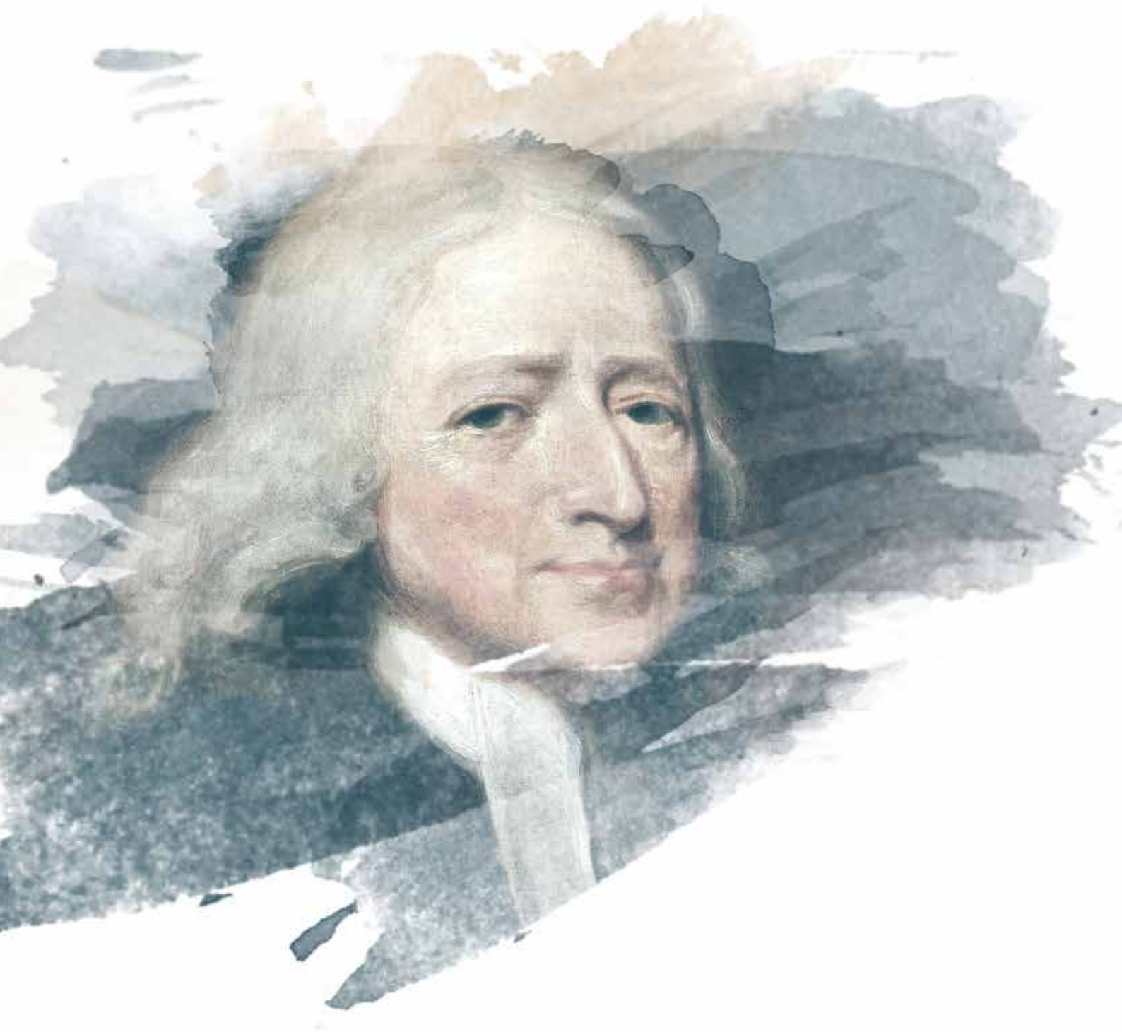
Джон Уесли, 1703 - 1791 Основател на методисткото движение