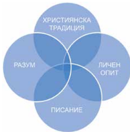
Източници на богословска последователност

В. Тези вярвания ни дават богословска последователност: